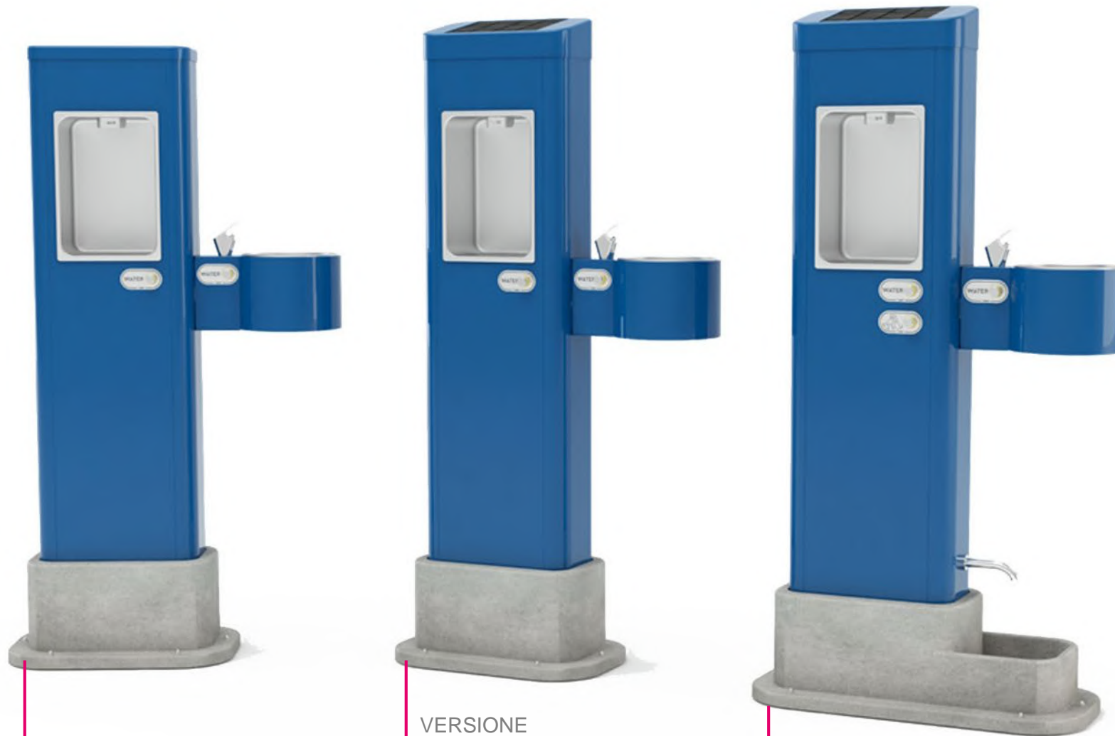
VERSIONE CON ZAMPILLO